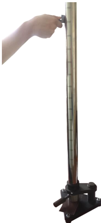
Рисунок 2.3. – Установка груза на необходимой высоте