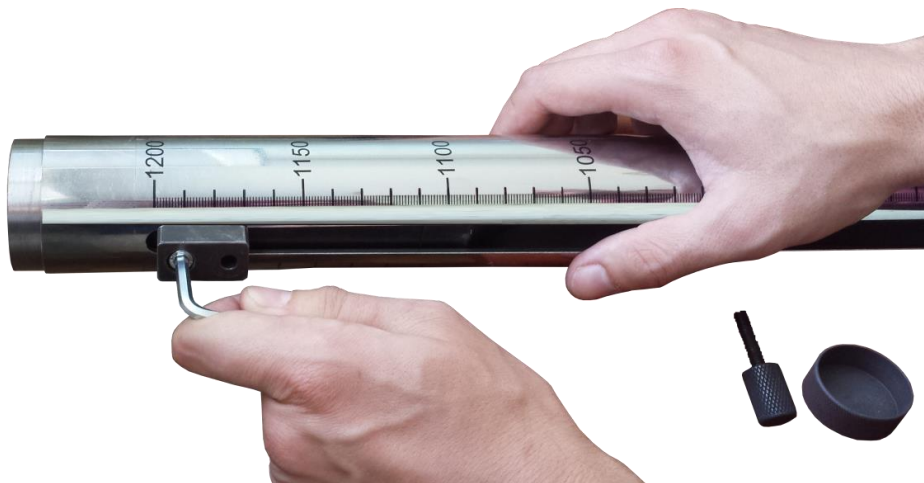
Рисунок 2.1 – Установка ударника внутрь направляющей трубы