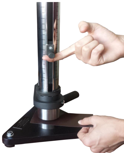
Рисунок 2.2. – Установка пластины для проведения испытания